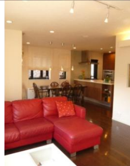
1 邸 2009.6.nt